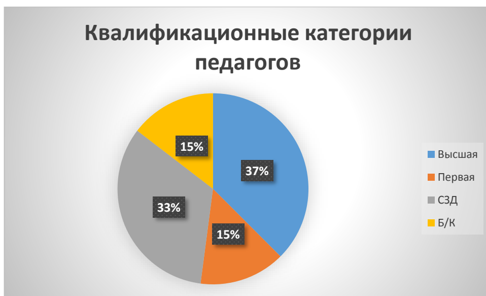
Таблица 11. Сведения о специалистах психолого-медико-социального сопровождения